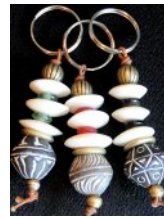
ATB-MTLBNE メタル & ボーン 47g 3x7.5cm