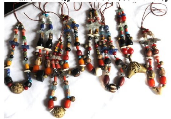
ATB-NECKLG トレードビーズネックレス (1.5mm 革紐) ビーズは変更になる場合がございます 123g

ビーズはガーナ、マリ、ナイジェリア、南アフリカ、エチオピア、および他の多くの国を含むアフリカ各地からの品を使用しています。ブレスレットは長さ 17 - 18cm、ゴムひもを一重または二重に通しています。ネックレスはビーズ部分 40cm、1mm の茶色革紐を通してあります。