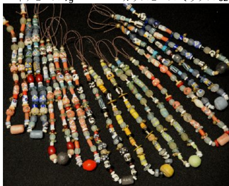
ATB-NECKSM トレードビーズネックレス (1mm 革紐) ビーズは変更になる場合がございます 56g