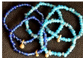
ATB-COCO ココイナビーズ 9g