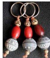
ATB-TOUAREG トアレグ テラコッタ & アンバー 29g 2.5x7cm