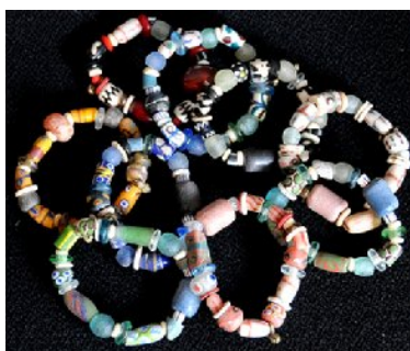
ATB-BRACE トレードビーズブレスレット 28g