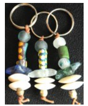
ATB-THINBONE ボーンビーズ 薄 28g 2.5x7cm

ご希望により、キーリングにアフリカントレードビーズのタグ(左上)をお付けいたします。長さ表示はビーズ部分のみ