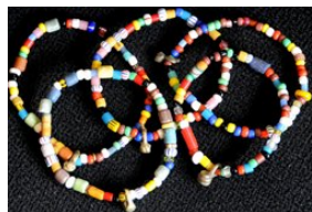
ATB-XMAS クリスマスビーズ 5g