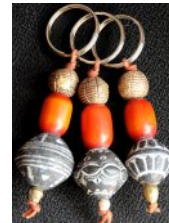
ATB-MALI マリ テラコッタ & アンバー 29g 2.5x7cm