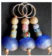
ATB-BBGs 青ガラスビーズ 大 51g 3.5x7cm