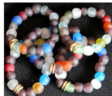
ATB-MXDGLASS ガラスビーズ ミックス 32g