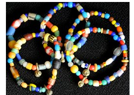
ATB-ASIA アジア ミックス ビーズ 9g