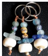
ATB-BONE ボーンビーズ 大 28g 3x6cm