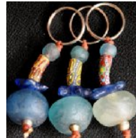
ATB-AQUA アクアガラスビーズ大 54g 3.5x7cm