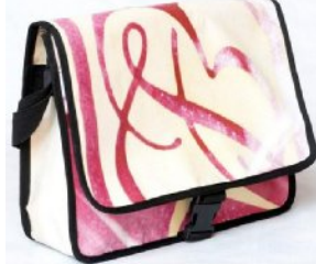
タビールバッグ 39x12x38cm C00007