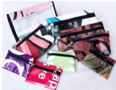
化粧ポーチ T-COSMETIC 筆箱 T-PENCIL バッグ (小) T-SMALL アリス スリングバッグ T-SLING