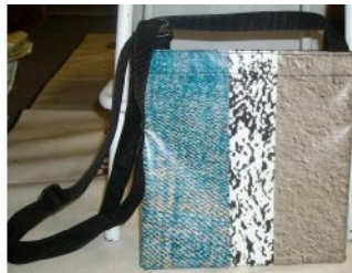
会議用バッグ C00024 32x11x32cm