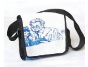
男女兼用 22x9x20cm C00039