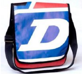
ツラニショルダーバッグ 29x7x33cm C00042