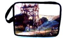
ラップトップバッグ 39x9x33cm C00022