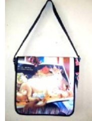
メディアバッグ 32x11x33cm C00038