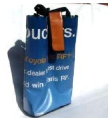
ワイン2瓶ボトルホルダー 26x9x36.5cm C00020