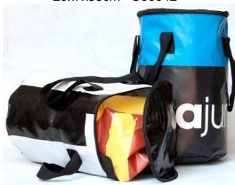
ストレージバッグ (筒型) C00004 29x46cm