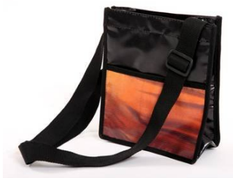
会議用バッグ (ポーチあり) 20x11x24 C00044