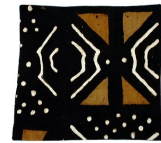
トラディショナル BOG/013 40x40cm BOG/014 50x50cm

ボゴロンクッション40X40 BOG/001,4,7,10,13 月生産量: 150 注文仕上り期間: 4 - 6週間 サイズ: 40x40cm 重量: 105g ボゴロンクッション50X50 BOG/002,5,8,11,14 月生産量: 150 注文仕上り期間: 4 - 6週間 サイズ: 50x50cm 重量: 150g マリ共和国で作られるボゴロンは、縦長に織られた布を縫い付け、泥染めしたものです