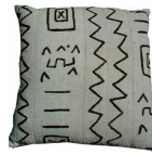
ボゴロン 白 BOG/004 40x40cm BOG/005 50x50cm