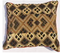
パイピングつきショーワ クッション 50x50cm CON/SHO/004