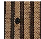
カーキ SWC/021 M 022 S