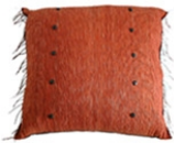
スワジクッション さび色