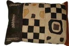
クバ織り 40x50cm KUB/001 45x60cm KUB/002

月生産量: 120 注文仕上り期間: 6 - 8週間 重量: 350 - 450 グラム ショーワ布は、コンゴ民主共和国のバクバ地域で手作りされています。それぞれ古くからの伝統的なデザインで織られており、これらの生地でもジタ・トレーディングはクッションを製作しています。現代のアフリカンシリーズのクッションカバーは、コンゴ民主共和国からのクバ、およびショーワ織りの布を使って作られた、高品質の製品です。それぞれ、南アフリカにおいてスエードまたはスエード風布地を使って仕上げられています。クバ、およびショーワ布は手作りで、模様は一つ一つ違います。ですので、クッションの模様やデザインは2つとして同じものはありません。洗濯はドライクリーニングをご使用ください。