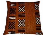
ボゴロン 茶 BOG/001 40x40cm BOG/002 50x50cm