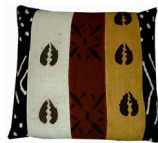
ボゴロン ストライプ BOG/010 40x40cm BOG/011 50x50cm