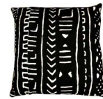
ボゴロン 黒 BOG/007 40x40cm BOG/008 50x50cm