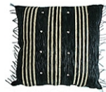
シマウマ SWC/007 M SWC/008 S