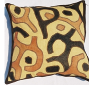
パイピングつきクバ織り クッション 50x50cm CON/KUB/004