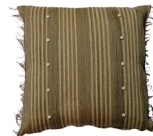
クッションオリーブ SWC/019 M 020 S