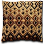
50x60cm MJ/SHO/001 ショーワクッション