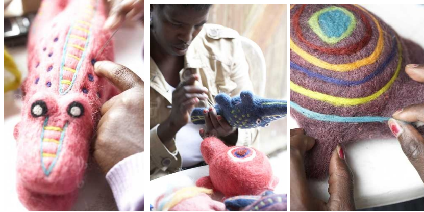
ヌノ動物園製作中